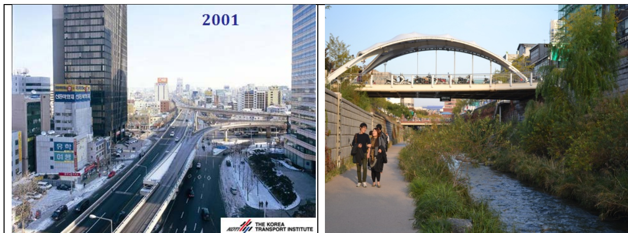
Bild 1 och 2 för och efter - Cheong Gye Cheon.